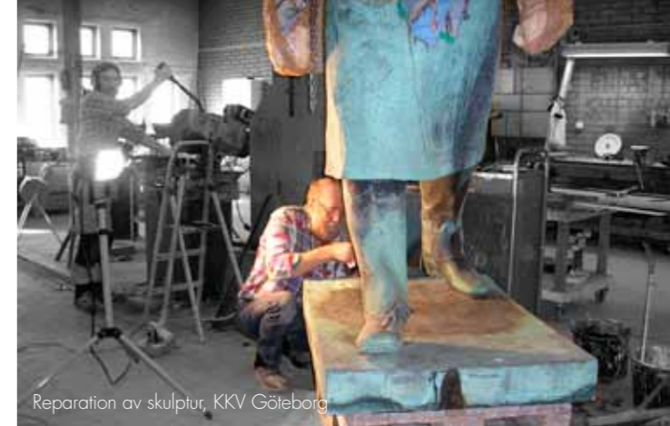
Reparation av skulptur, KKV Göteborg

Och kursen är en framgång vilket inte minst visar sig i att många konstnärer som aldrig tidigare utfört offentlig konst fått uppdrag efter utbildningens slut.