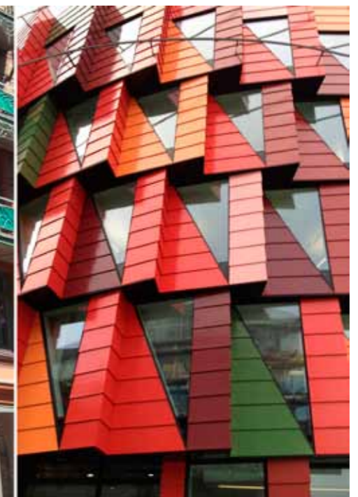
Fasaden till höger är byggd 115 år senare än den till vänster.