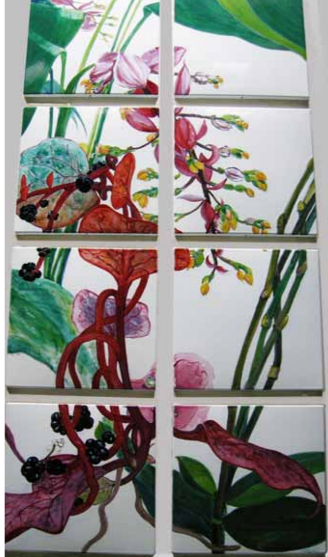
Emaljer innan uppsättning i entré.

Exempel på konst som satt sin stad på kartan i Västra Götalandsregionen är Jim Dines Pinocchio i Borås och Carl Milles Poseidon i Göteborg. En gemensam egenhet för båda är att den ena har för litet och den andre för långt organ i förhållande till kroppen. Båda kritiserades i början. "Vem har beslutat att en Disney-figur skall sätta textilindustristaden på kartan?" Nu accepterar nog många i konststaden Borås att myten om mannen, som ur ett trästycke får fram en livslevande pojke, kan vara symbol för Konsten.