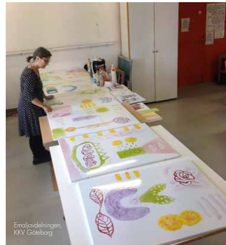
Emaljavdelningen, KKV Göteborg