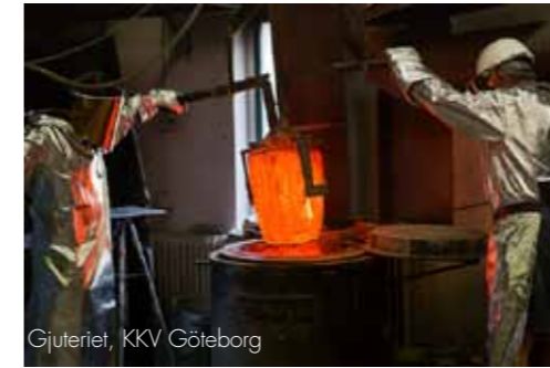
Gjuteriet, KKV Göteborg